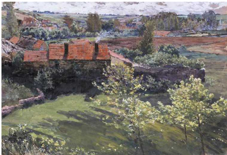
Antonín Slavíček - Červnový den