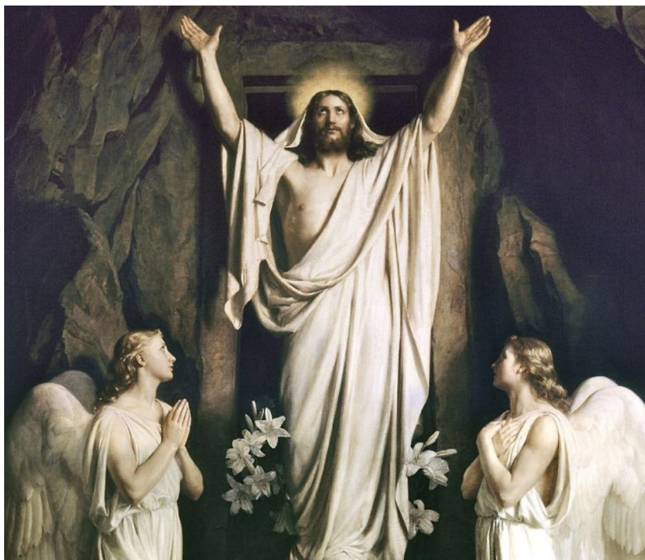
Carl Bloch - Zmrtvýchvstání Kristovo