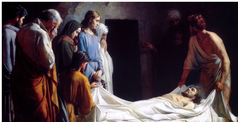
Carl Bloch - Pohřeb Kristův