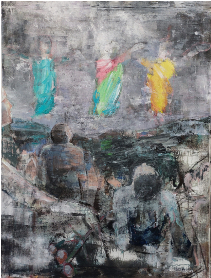
br. Dan Balabán - Transfigurace (2016)