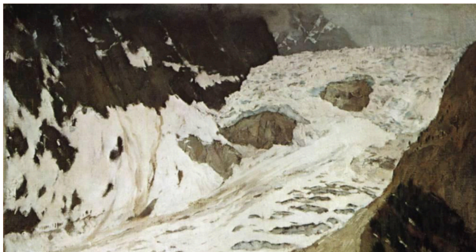
Isaac Levitan - Alpy. Sníh.