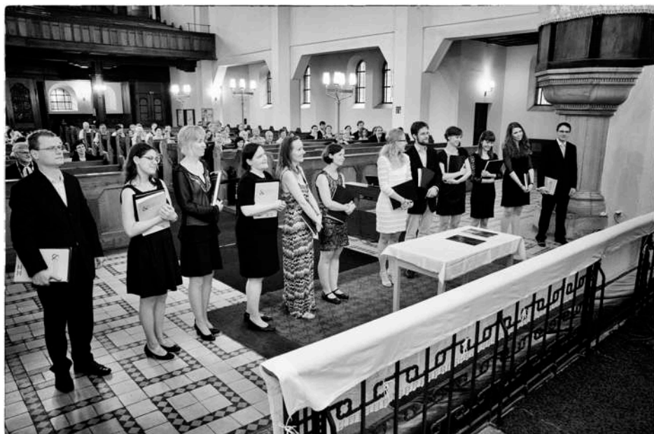
Absolventi Semináře církevní hudby Evangelické akademie, 26.6.2016