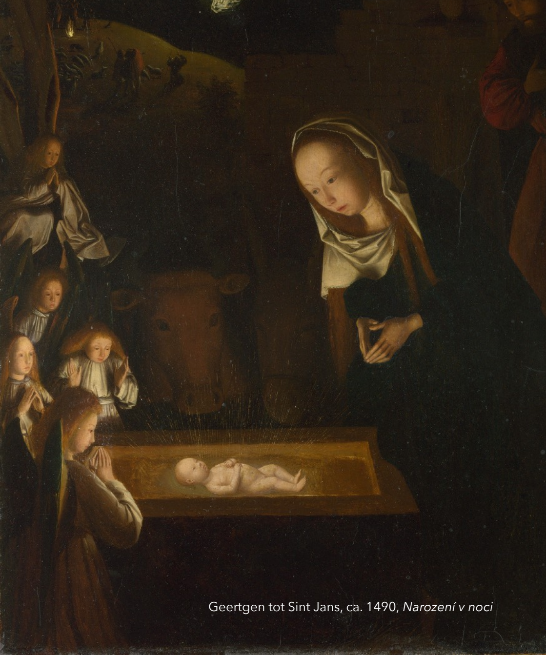
Geertgen tot Sint Jans, ca. 1490, Narození v noci

sboru Českobratrské církve evangelické v Ostravě