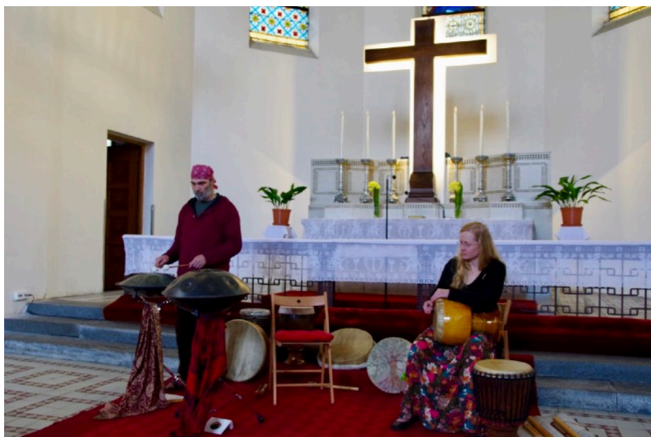
Rytmy Země (manželé Plecháčkovi)