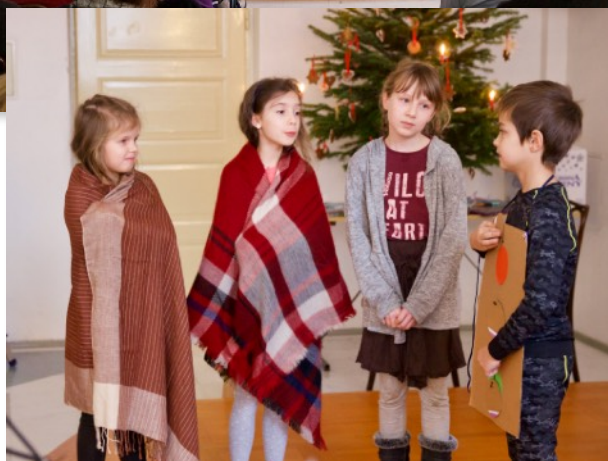
Vánoční hra se zpěvy „Pravé světlo“ (23.12.)