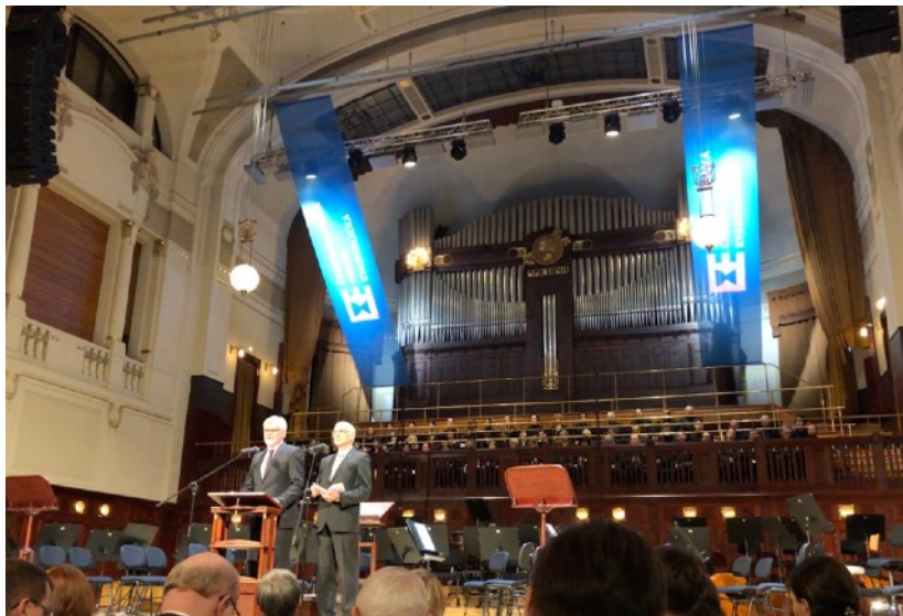
16. prosince proběhlo slavnostní shromáždění v Obecním domě v Praze ke stému výročí ČCE