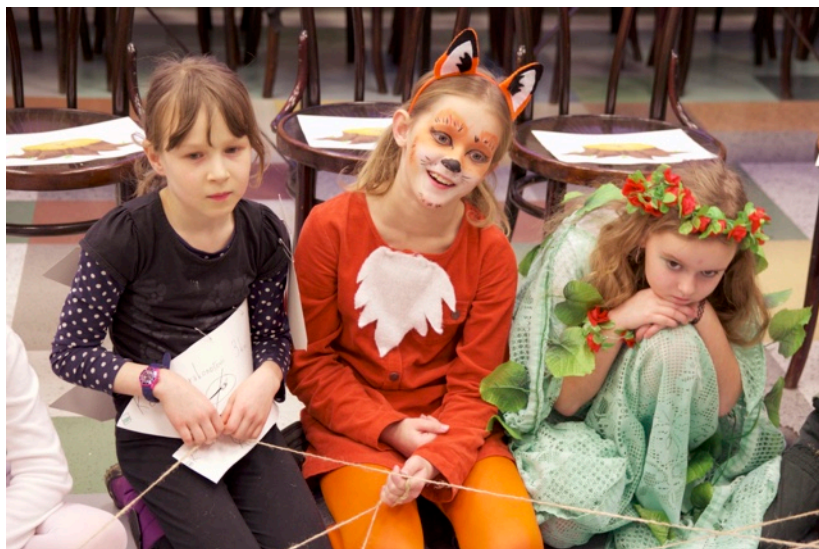
Dětský karneval, 25.2.2017