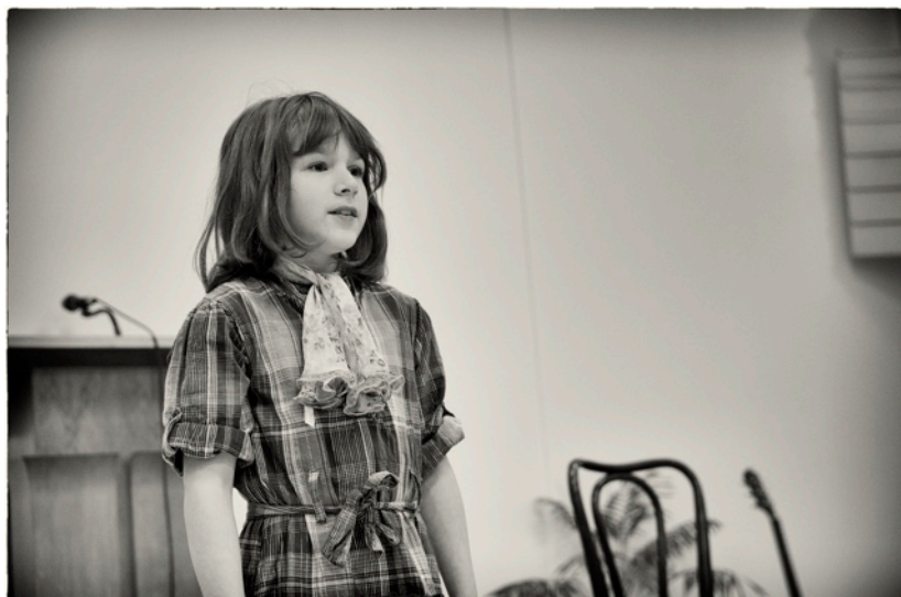
Tříkrálový koncert, 8.1.2017