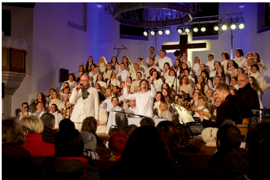
Ostrava zpívá gospel, 11.12.2017