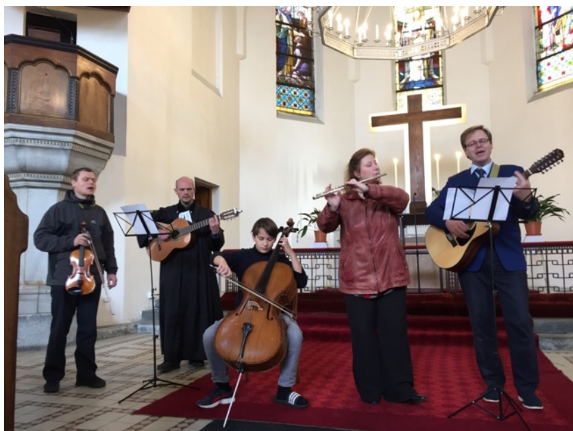
Z bohoslužeb 9. října