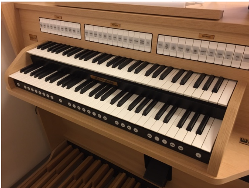
Nové digitální varhany uslyšíme v Tránovského sále