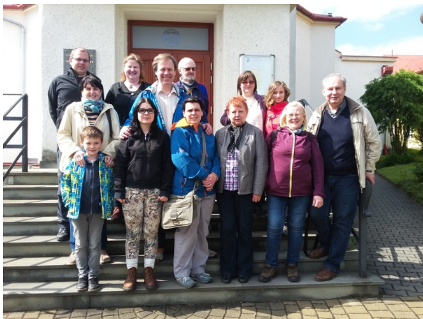
Účastníci sborového výletu za luterskými kostely na Těšínsku, 14.5.2016