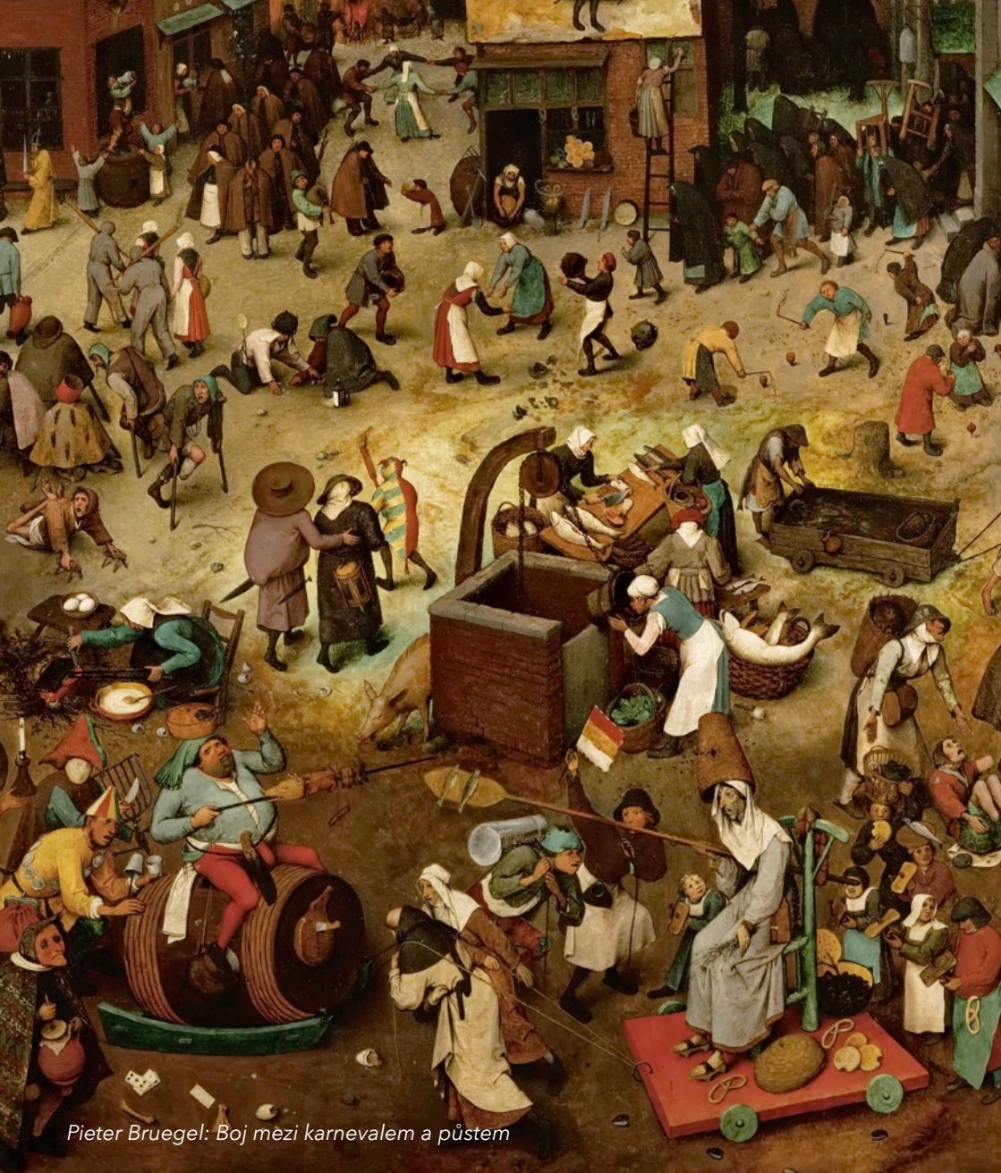
Pieter Bruegel: Boj mezi karnevalem a půstem

sboru Českobratrské církve evangelické v Ostravě