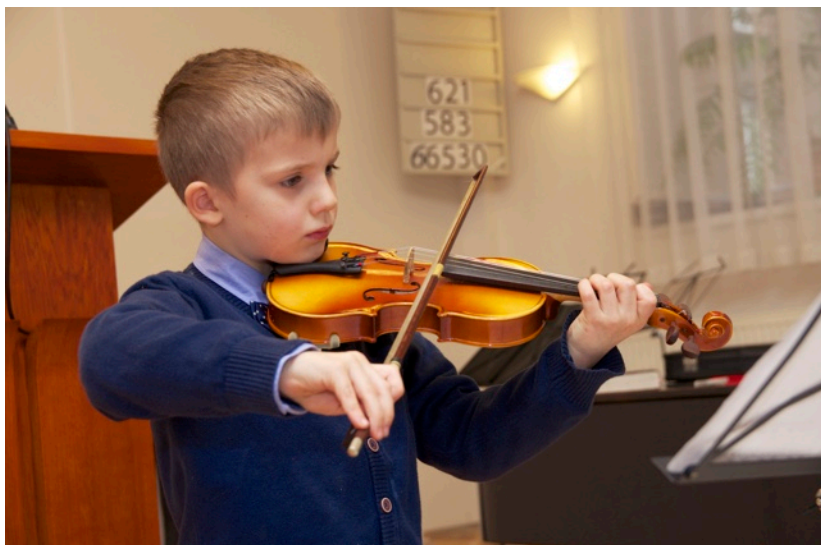
Tříkrálový koncert, 3. ledna 2016