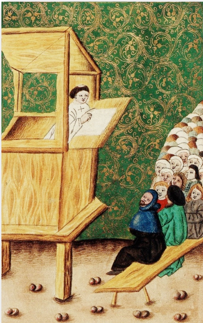
Jan Hus na kazatelně, Jenský kodex (ca 1490)

sboru Českobratrské církve evangelické v Ostravě