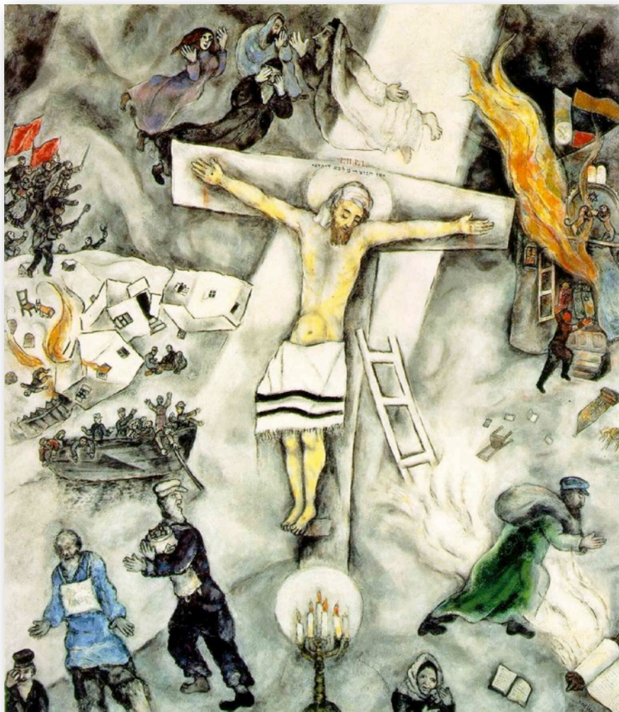
Marc Chagall: Bílé ukřižování

sboru Českobratrské církve evangelické v Ostravě