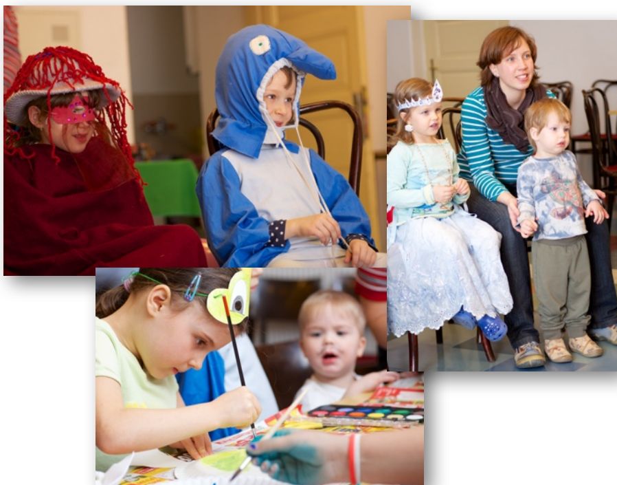
Dětský karneval pod titulem Vodní svět se konal 14.2.