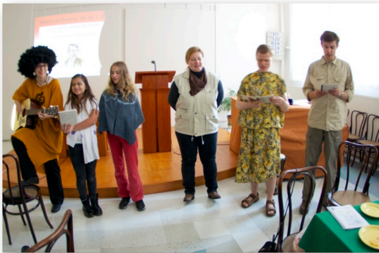
Rodinné bohoslužby a ohlédnutí za prázdninami 7.9.2014