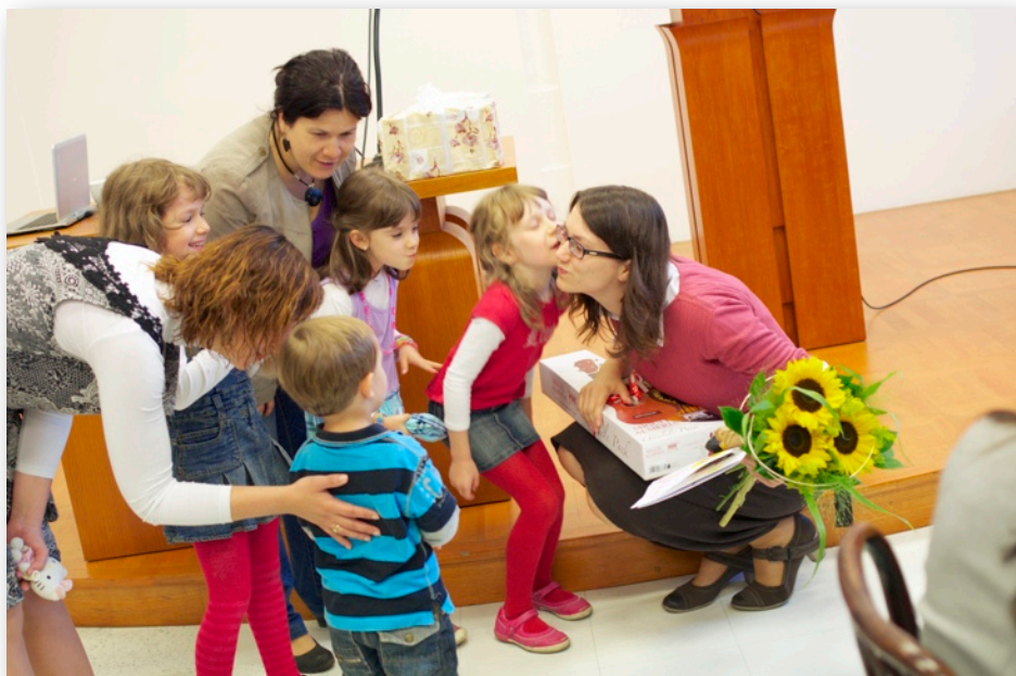
Narozeninové gratulanti (21.9.2014)