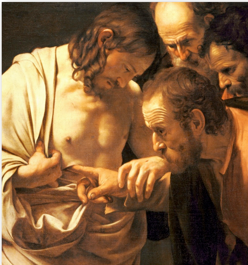
Nevěřícnost sv. Tomáše - Caravaggio (detail)

sboru Českobratrské církve evangelické v Ostravě