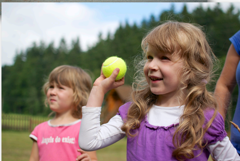
Na seniorátní rodinné dovolené ve Velkých Karlovicích nás bylo letos přes 50