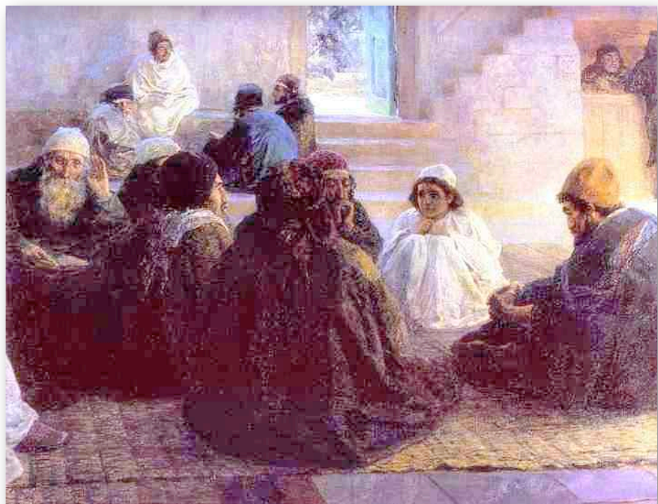
Ježíš s učiteli