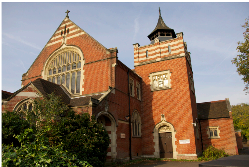
Partnerský sbor Purley United Reformed Church