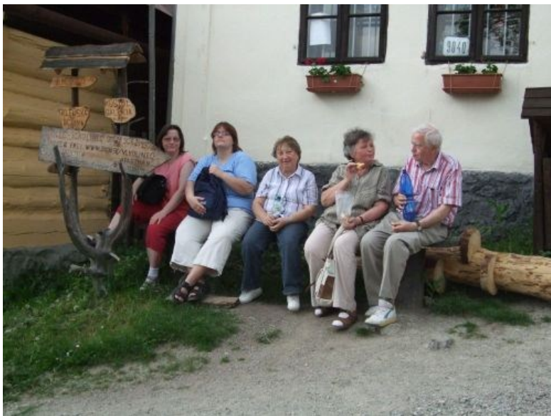
Foto1+2:Sborový zájezd na Slovensko