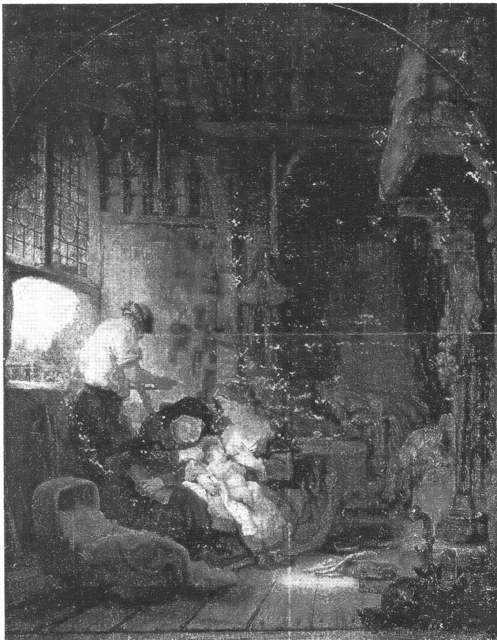
Rembrandt (1606—1669) Svatá rodina (1640)