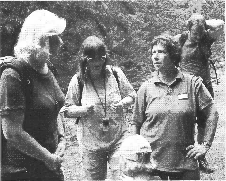
foto ze sborové dovolené v Západních Tatrách