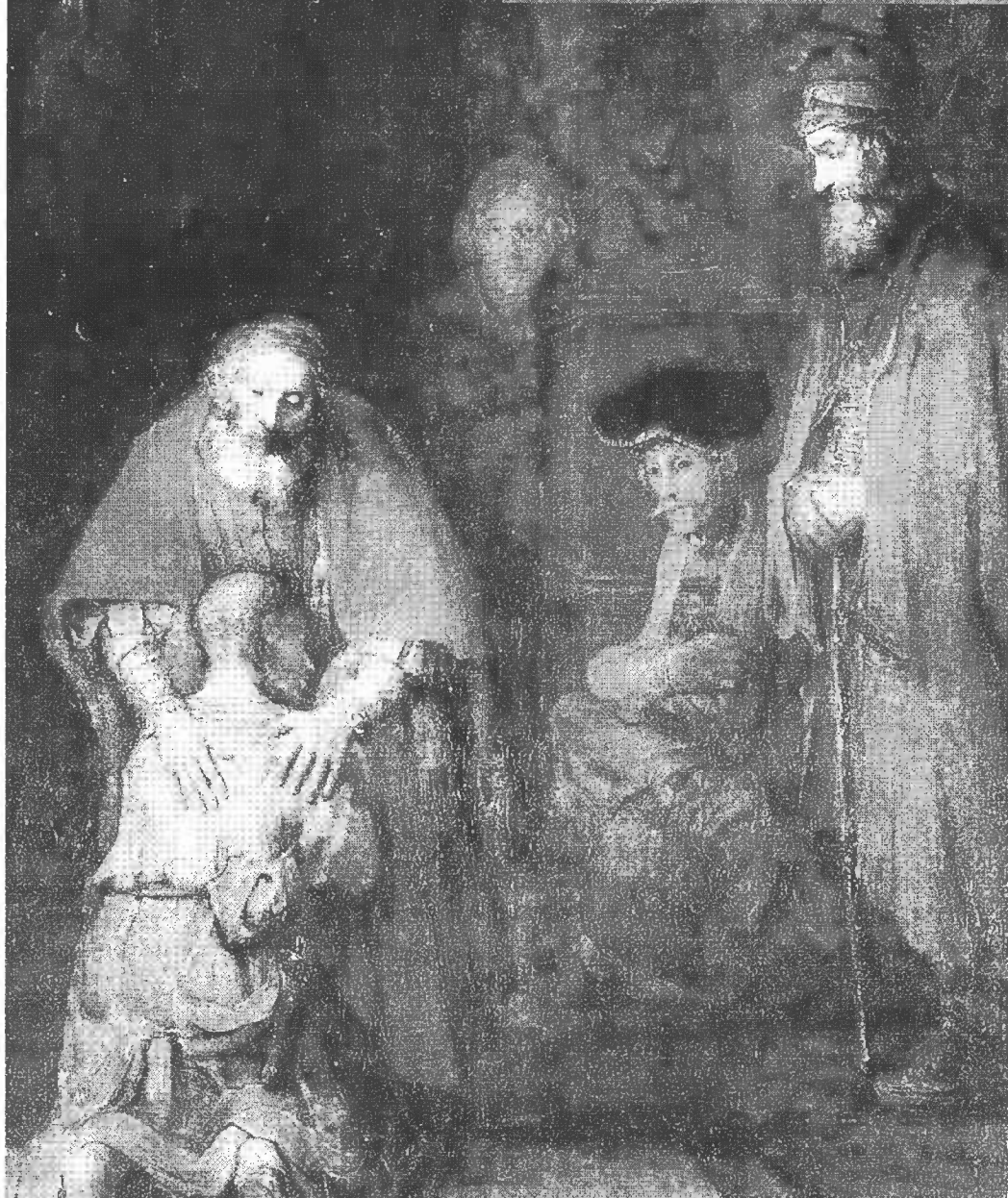
Rembrandt (1606—1669) Návrat marnotratného syna (1660) (čti L 15,11-24)