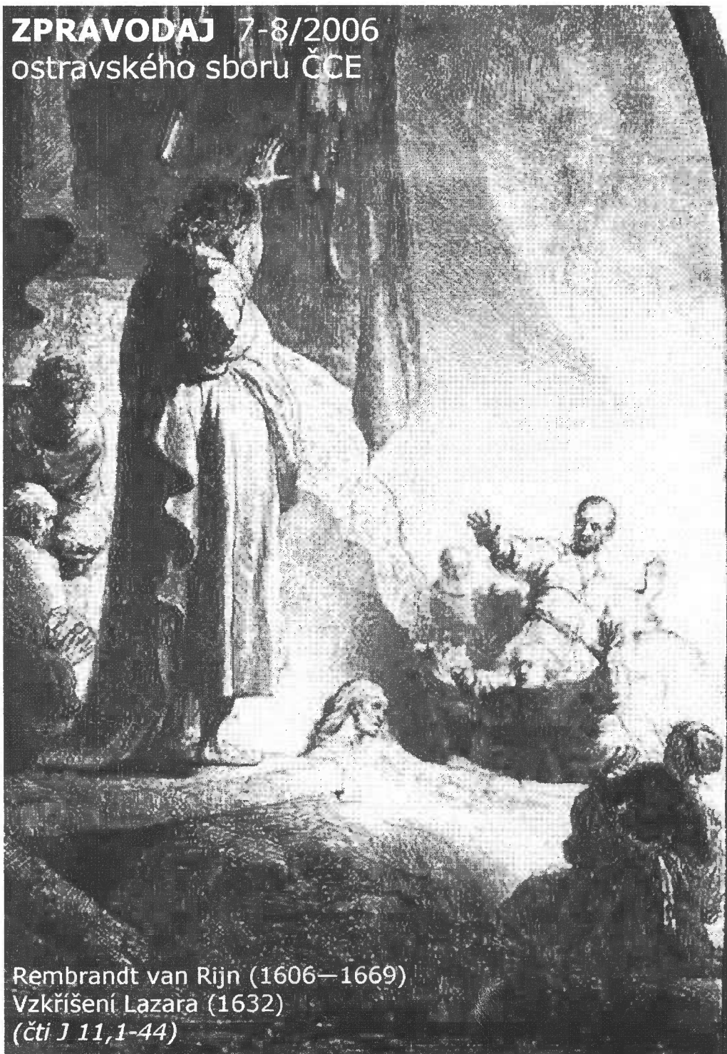
Rembrandt van Rijn (1606—1669) Vzkříšení Lazara (1632) (čti J 11,1-44)