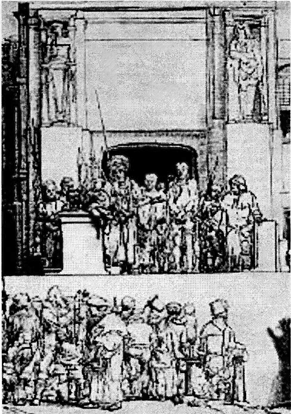
Rembrandt van Rijn (1606—1669) Ecce homo (1665) (čti J 19,1-5 „Hle člověk.“)