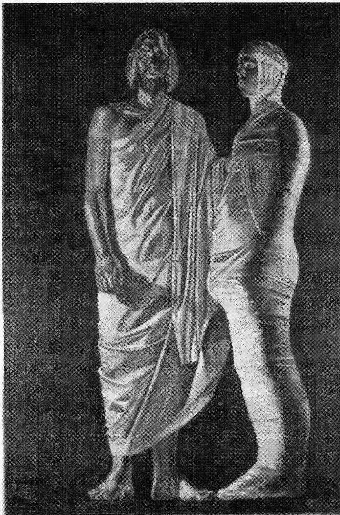
JEŽÍŠ VE VÝTVARNÉM UMĚNÍ 20. STOLETÍ: Vzkříšení Lazara (A. Leslie 1975) (čti J 11)

FARNÍHO SBORU ČESKOBRATRSKÉ CÍRKVE EVANGELICKÉ V OSTRAVĚ