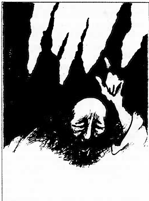
ilustrace: Barbora Veselá

Naše rubrika Názory - Diskuse - Polemika v posledních číslech přinesla několik příspěvků, vzájemných reakcí a doufejme že přibude i témat, ke kterým budeme otevřeně sdělovat své názory.