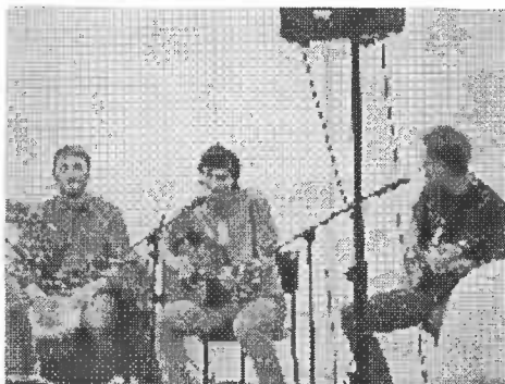
Foto:hudební skupina Mindenki, na Ostravském listopadání 9. - 11. 11. 2007