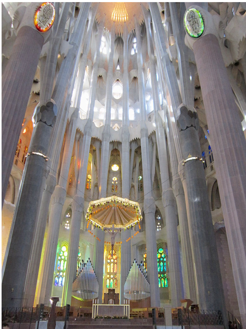
Oltář v chrámu Svaté rodiny (Sagrada Família), v Barceloně. Stavební práce na něm začaly v roce 1882, trvají dodnes. Chrám je hlavní stavbou slavného architekta Antonia Gaudího.