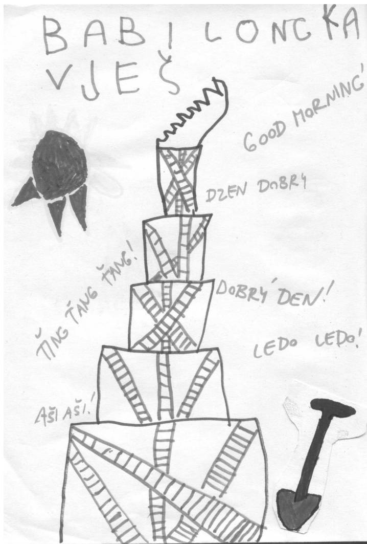
Anička Sabóová (5 let)

sboru Českobratrské církve evangelické v Ostravě