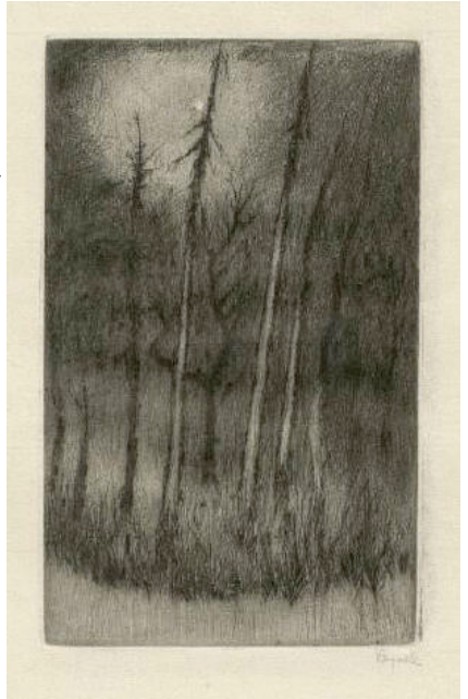
(B. Reynek, Rty a zuby , 1925)

V slunném únorovém ránu, tvrdém jako z porcelánu, ptáče pod okny mi tiká, volá srdcí zahradníka; tiká tichem beze břehů, úzkost po hladinách sněhu neúprosných rozbíhá se, rozpuštěna v táhlém hlase osamělém... Velkonoce, žel, jen jedenkrát jsou v roce, nouze jest o vykoupení větší nežli o chléb denní, jehož nelze polykati pro bolest, jež s vášní katí hrdlo hladové nám svírá... Pane, nedávej nám štíra, dej nám aspoň drobtý psíků, rozhřejí se na jazyku, který div se nevzňal kvíle... Kraj jest jako vejce bílé černě prožíhané stromy. Kdy se skořápka rozlomí, kdy jak poupě rozevře se, jako zamrzlá tuň v lese, a kdy ptáčeti, jež tiká, ozve se hlas zahradníka, který, shodiv sních a plátna, oděn v ran roucha brunátná, náhle osvítlí nám stezku v dlani květem snu a blesku?