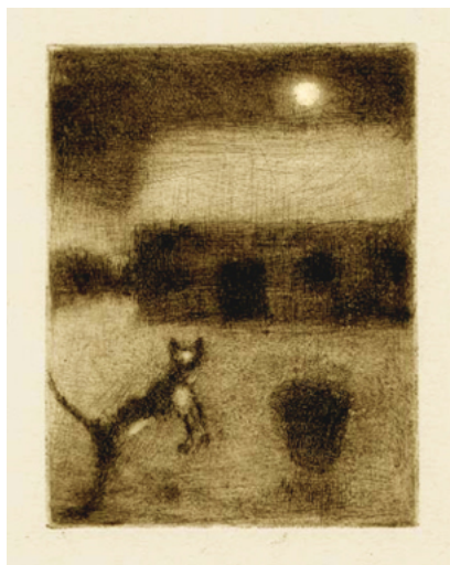
Zimní motivy pocházejí z grafické tvorby B. Reynka