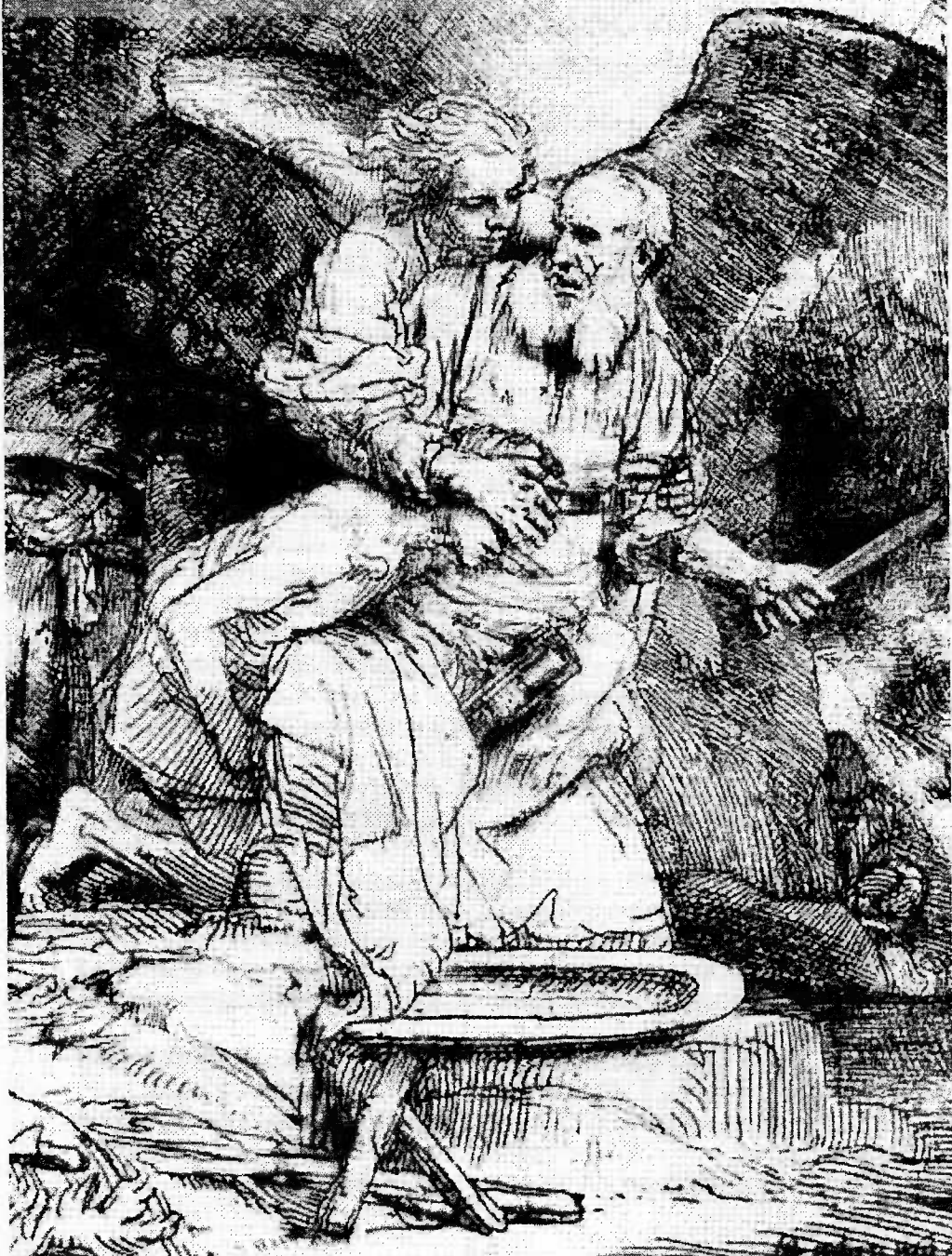
Rembrandt (1606–1669) Oběť Abrahamova (1655) (čti Gn 22,1-15)