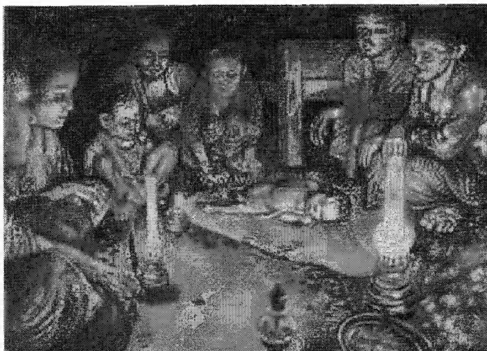
JEŽÍŠ VE VÝTVARNÉM UMĚNÍ 20. STOLETÍ: Narození (Andi Harisman, Indonésie 1990) (čti L 2,1-20)

FARNÍHO SBORU ČESKOBRATRSKÉ CÍRKVE EVANGELICKÉ V OSTRAVĚ