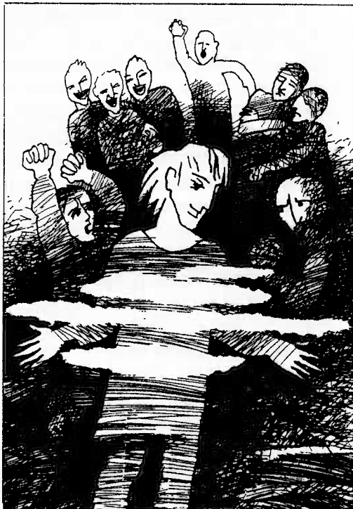
ilustrace: Barbora Veselá

Ve světě stupňujícího se terorismu, nesmiřitelnosti, neúcty k životu i k životu vlastnímu - zní Ježíšova slova až absurdně. A přesto: jak jinak přerušit bludný kruh odplat, odvet, vyrovnávání účtů... než respektováním druhých lidí a modlitbami za jejich (alespoň) zdravý rozum.