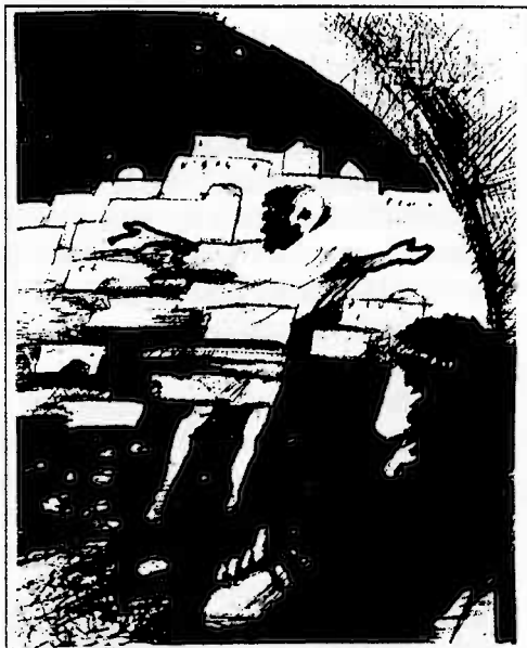
ilustrace: Barbora Veselá

Doufáme, že i tento Zpravodaj vám přinese řadu podnětných myšlenek a informací - aktuální biblický úvodník, oznámení, ale i hlubší nahlédnutí do sborového života, několik zpráv z jednání synodu.