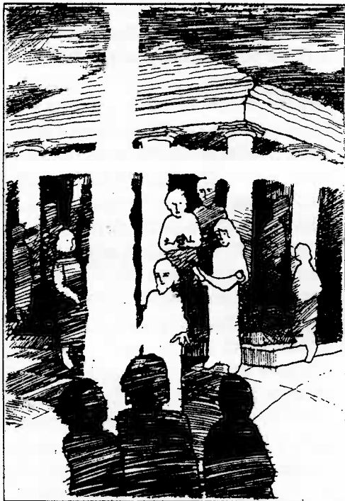
Ilustrace: Barbora Veselá

Měsíc květen je bohatý na svátky - světské i církevní. I když svátky Nanebevstoupení a Svatodušní nejsou tak zažity v povědomí lidí, přináší výraznou biblickou zvěst a živou naději.