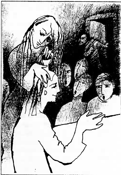
Ilustrace: Barbora Veselá

Skromný rozsah dubnového Zpravodaje nás může více soustředit na velikonoční evangelium v biblickém úvodníku a několika připojených citátech.